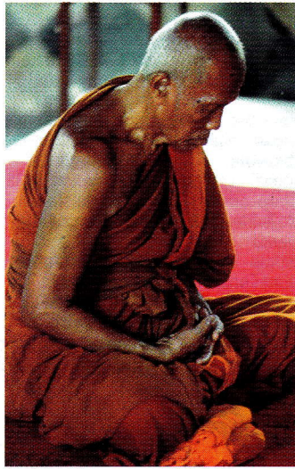
Meditierender buddhistischer Mönch

Die Meditation ist eine in vielen Religionen und Kulturen ausgeübte spirituelle Praxis. Durch Konzentrationsübungen soll sich der Geist beruhigen und sammeln. In östlichen Kulturen gilt sie als eine grundlegende und zentrale bewusstseinsweiternde